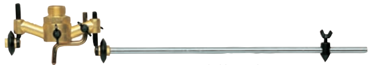
R-69-980 leikkaus tuki