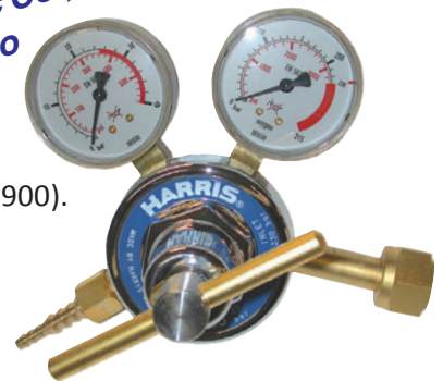
825D-25-OX suurteho happisäädin

Harris Calorific Co., Cleveland, Ohio (U.S.A.)