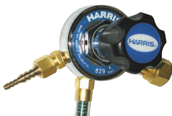
829-mallin kelloton säädin