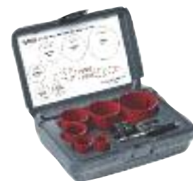
Malli 1248 Putkiasentajan sarja