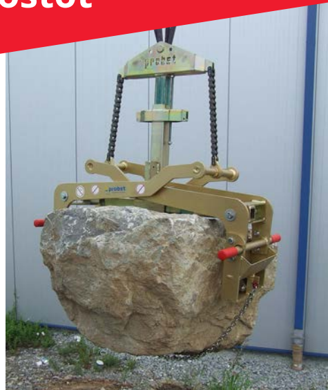
FTZ-MULTI-15 / WB-SQ