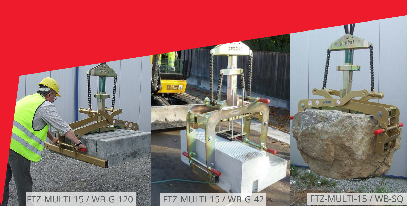
FTZ-MULTI-15 / WB-G-120