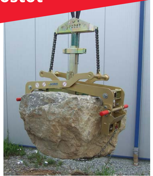
FTZ-MULTI-15 / WB-SQ