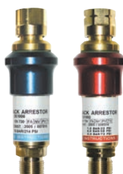
DS 1000R/L takaiskusuojat